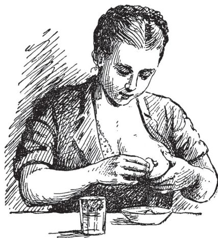
Рис. 2. Обмывание соска перед кормлением

Перед тем как приложить ребенка к груди, нужно вымыть руки теплой водой с мылом и после этого обмыть сосок и участок кожи вокруг соска ваткой, смоченной кипяченой водой, так как при сосании захватывается не только сосок, но и околососковый кружок (рис. 2).