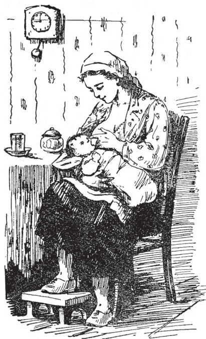
Рис. 1. Правильное положение матери во время кормления грудью

После выписки из родильного дома женщина должна строго соблюдать правила кормления ребенка. Кормить надо сидя на невысоком стуле, чтобы можно было опереться спиной на его спинку; одну ногу (при кормлении правой грудью — правую, при кормлении левой — левую) надо ставить на невысокую скамеечку. При таком положении мать меньше утомляется (рис. 1).